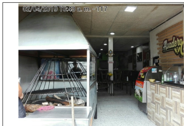
Fotografía N°4. Horno de asar.