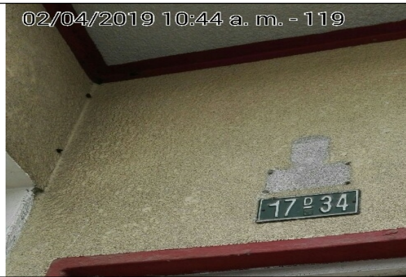
Fotografía N°2. Nomenclatura urbana del predio vecino más cercano.