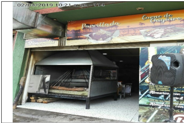
Fotografía N°1. Fachada del predio.