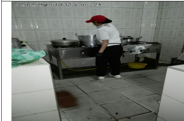
Fotografía N°3. Área de cocción.