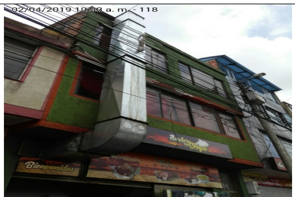
Fotografía N°5. Ducto de desfogue de horno.